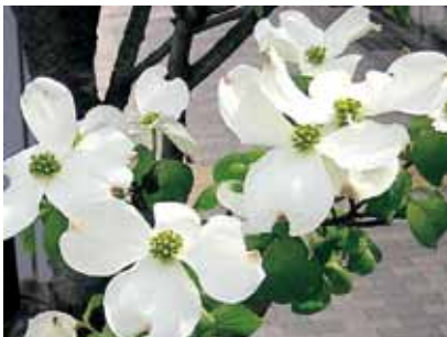
ハナミズキ（イメージ写真）

※対象の赤ちゃんに対して複数応募があった場合、配布記念樹は1本とさせていただきますのでご了承ください。