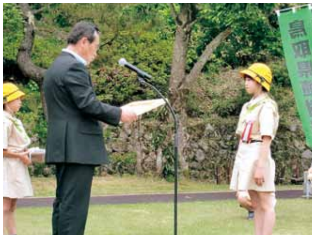
優秀賞（緑化推進委員会理事長賞） 「氷ノ山 緑にかこまれ 生きる森」

昼食時にはアトラクションとして、若桜氷ノ山樹氷太鼓の会の太鼓、若桜麒麟獅子舞保存会の獅子舞が披露されました。