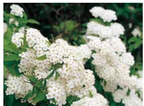
コデマリ（イメージ写真）