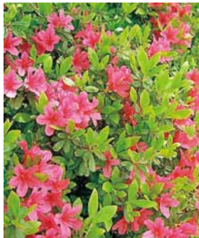
キリシマツツジ（イメージ写真）